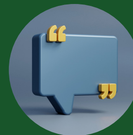
Photos de conférenciers et citations pour le partage social.