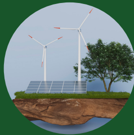
Infographies sur les défis du financement climatique en Afrique et les solutions discutées lors du sommet.