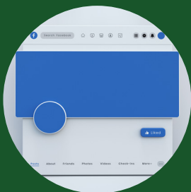
Bannières pour les plateformes de médias sociaux (Twitter, Facebook, LinkedIn, Instagram)

Les visuels sont un outil puissant pour transmettre le thème du Sommet et impliquer votre public. Voici quelques éléments visuels que vous pouvez utiliser dans vos posts :